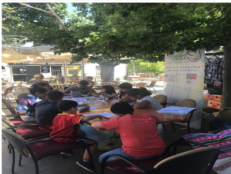
( http://www.fuenteheridos.es/export/sites/fuenteheridos/es/.galleries/imagenes-noticias/Noticias-2018/thumbnail_FUENTEHERIDOS-2018-6.jpg )