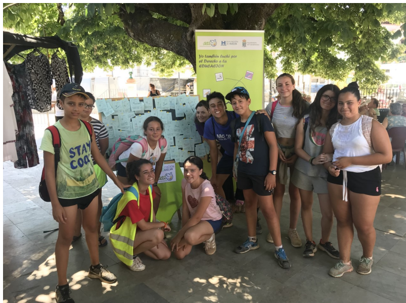
( http://www.fuenteheridos.es/export/sites/fuenteheridos/es/.galleries/imagenes-noticias/Noticias-2018/thumbnail_FUENTEHERIDOS-2018-7.jpg )